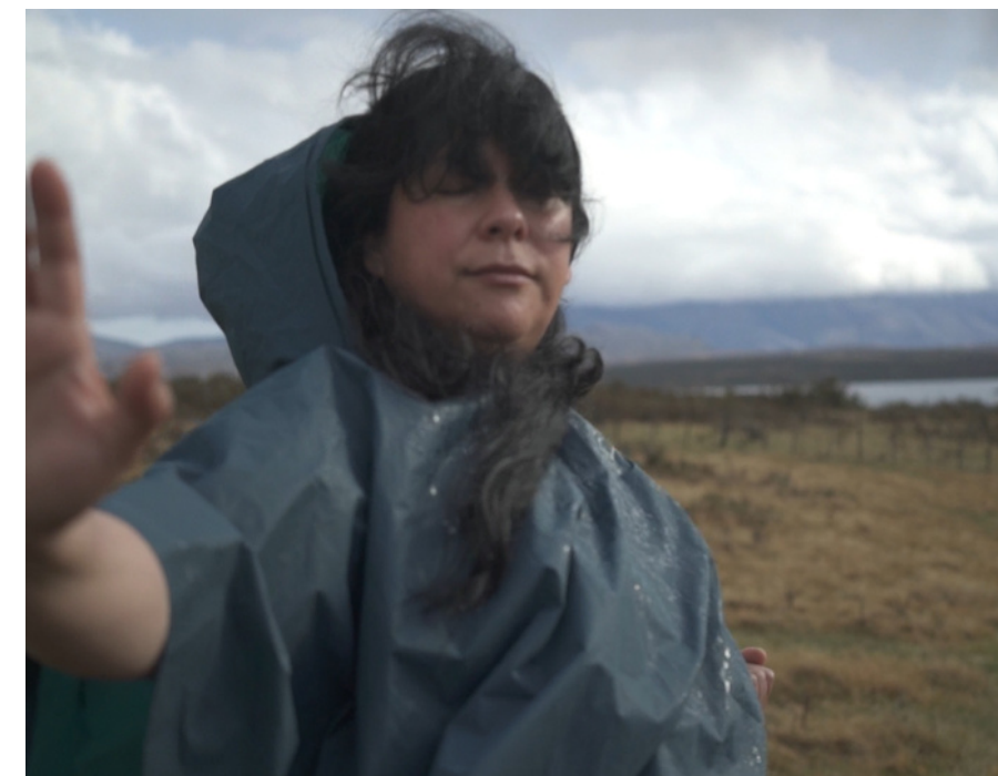
[Residencia Paula Almonacid, proyecto Isla] - Los Lagos, Chile Disciplina: Teatro Puerto Natales: 02 al 07 de octubre