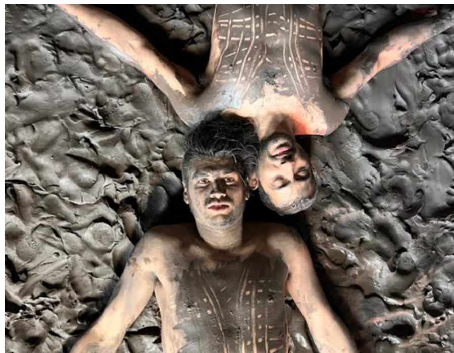
[Residencia Compañía Hold-up & Co, proyecto Huellas] - Francia Disciplina: Circo Contemporánea Punta Arenas: 02 al 22 de enero.